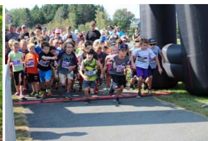
Départ du 1 km