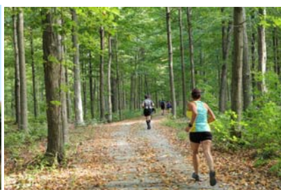
Parcours du 12,5 km